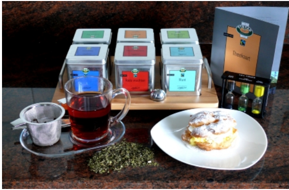
Lekker genieten van een heerlijke Slow Tea

Komt u op uw elektrische fiets en is uw accu bijna leeg? Bij ons kunt u uw accu onder het genot van een lekker drankje gratis opladen.